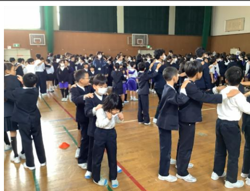
じゃんけんの前にあいさつします