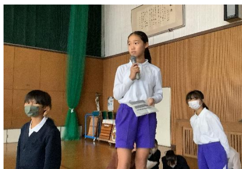
みんなの様子を見て司会・進行